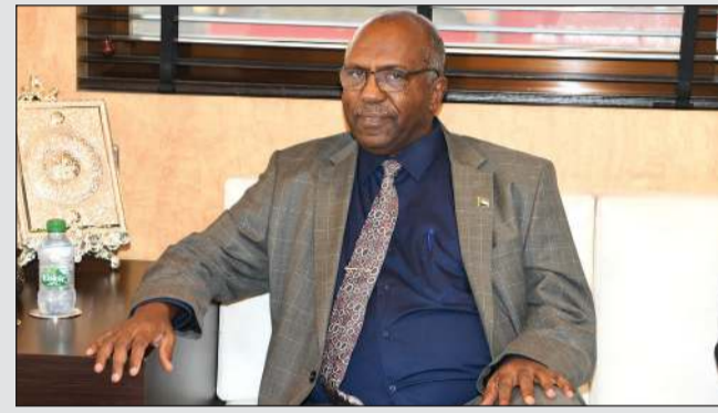
السفير عوض الكريم الريح بلة

استقبل رئيس التحرير يوسف خالد المرزوق السفير السوداني بلة. وشهد اللقاء مناقشة عدد من القضايا المشتركة، إضافة إلى بحث سبل تعزيز التعاون الإعلامي بين جريدة «الأنباء» والسفارة السودانية لخدمة مصالح البلدين والشعبين الشقيقين.