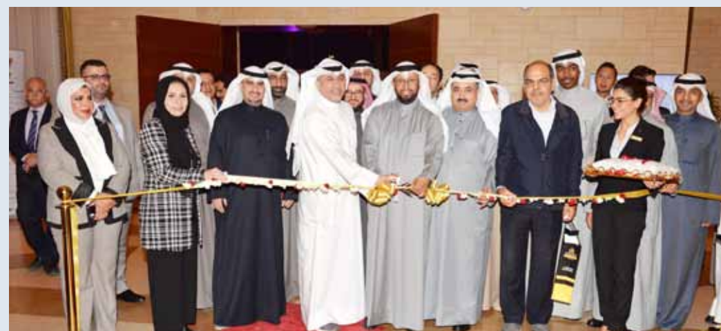
الوزير عمار العجمي يقص شريط الافتتاح

المقبلين على بناء بيوتهم. وأفادت وفائي بأن المعرض هذا العام يطرح أحدث ما توصلت إليه صناعة البناء والتشييد في العالم، بما يلبي احتياجات السوق الكويتي من مواد البناء، واحتياجات المواطنين في هذا الشأن من خلال العديد من شركات