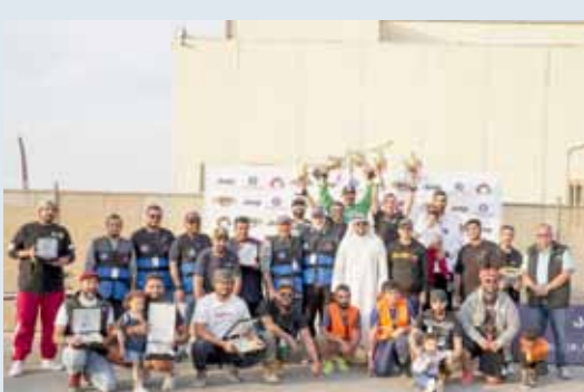
صورة جماعية مع الفائزين

في فعالية مثيرة وممتعة، نظمت شركة الملا وبهبهاني - الموزع المعتمد لسيارات الفا روميو، إيلارت، كرايسلر، دودج، فيات، جيب، رام بالتعاون مع نادي موبار الكويتي، يوماً مفتوحاً في نادي باسل سالم الصباح لسباق السيارات والدرجات، تخلله العديد من الفعاليات والأنشطة