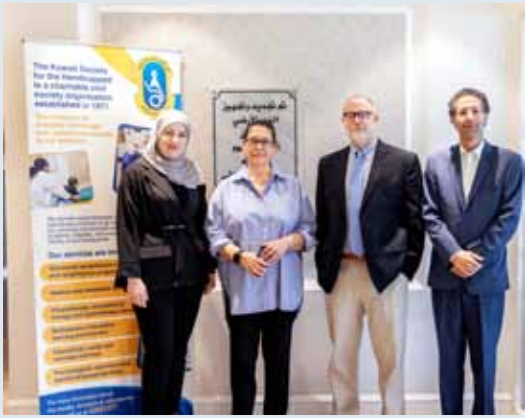
جانب من فعالية الافتتاح

دخلت «أجيليتي»، المشغل والمستثمر الطويل الأمد في ابتكارات وخدمات سلسلة الإمداد والبنية التحتية، في شراكة مع الجمعية الكويتية لرعاية المعاقين، منتجاً أو خدمة جديدة، أو يساهم في تحسين مستوى الخدمة وتطويرها، إضافة إلى أهمية أن يكون الاقتراح قابلاً للتنفيذ، ومتضمناً خطوات ومراحل التنفيذ، وأن يساهم بفاعلية في ترشيد المصروفات وزيادة العائد المادي.