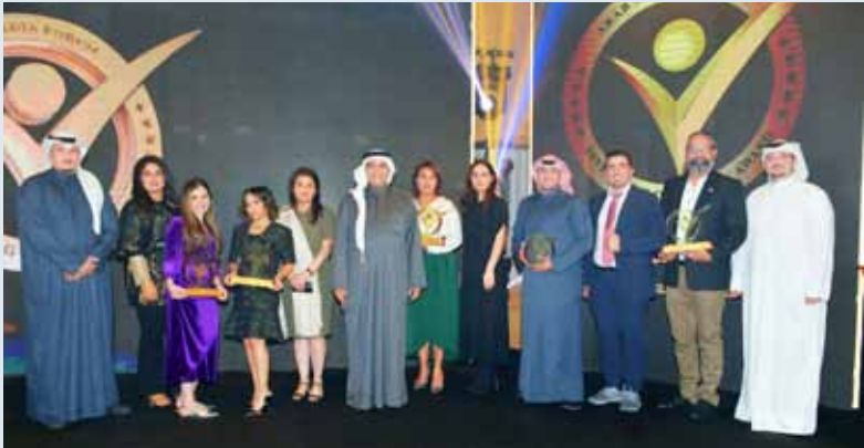
ماضي الخميس متوسطاً فريق stc